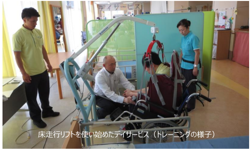
床走行リフトを使い始めたデイサービス（トレーニングの様子）

住む人・働く人 みなにとって穏やかな場であるよう様々な取組みをおこなっています。