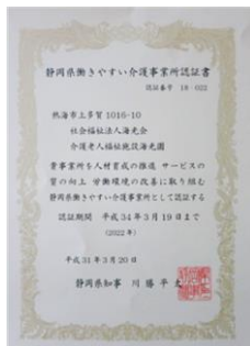
静岡県働きやすい介護事業所認証