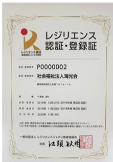
レジリエンス認証更新 (ゴールド色)