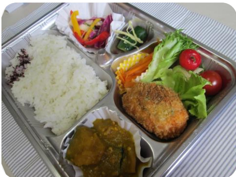
低カロリーなのに栄養満点

健康づくりは食事から！ということで2018年6月から地元野菜をふんだんに使用したヘルシー弁当を月2回提供しています。費用はヨガ教室もお弁当も会社負担でおサイフにも安心。第1回メニューは、とりささみのチーズ巻き/にんじんの金平/レタス&トマト/カボチャのそぼろあん/野菜の酢漬け/さくらんぼ。17品目も摂れてカロリー470Kcal 質量ともに◎です！目的は、自分の生活習慣を見直すきっかけとした大人の食育。シンプルな味付け、適正な量というものを目と舌で覚えることで生活習慣病を予防し公私ともにベストを尽くせる体調維持につなげていきたいものです。