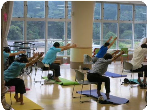
心も体もリラックス

職務特性として、車移動による運動不足、様々な対応で気持ちが疲れるという課題があります。そこで、2017年9月から職員向けのヨガ教室を月2回スタート。業務終了後に地元のヨガインストラクターさんから60分間のレッスンです。ゆっくり息を吸って～吐いて～・・・気持ちも体もゆっくり開放していきます。平均して参加人数は10名前後、気持ちが落ち着くと好評です。