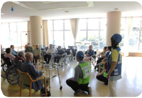
6月 風水害想定訓練