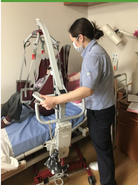
リフト操作はすべてのケアスタッフが習得済み

住む人、働く人、遊びに来 る人、皆にとって穏やかな 場であるよう様々な取組み をおこなっています。