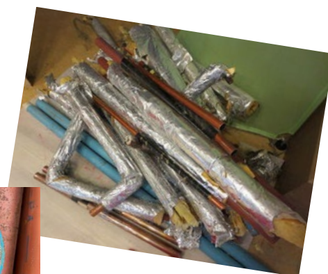
23年間使用した 管内部 (サビ)