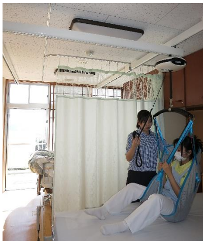
プライバシーカーテンを閉じて使用可能